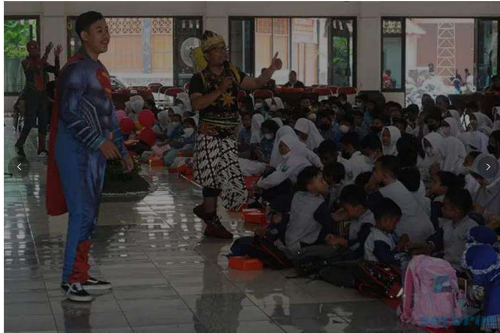
SOLOPOS.COM - Pegiat literasi berkostum superhero Gatotkaca dan Superman mendongeng bersama anak-anak di Klaten, Jawa Tengah, Kamis (24/11/2022).

Solopos.com, KLATEN — Pegiat literasi berkostum superhero Gatotkaca, Spiderman, dan Superman mendongeng dihadapan anak-anak mulai dari TK hingga